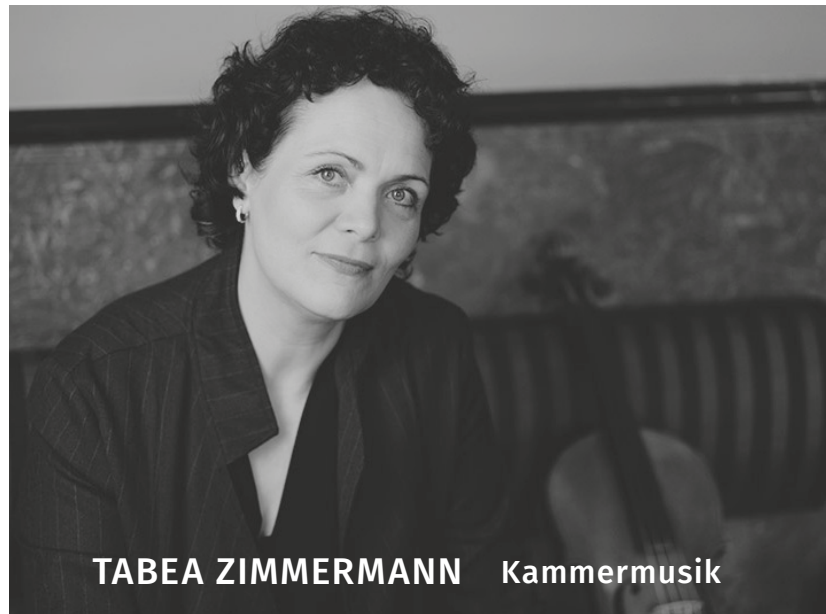
TABEA ZIMMERMANN Kammermusik

→ https://www.tabeazimmermann.de/